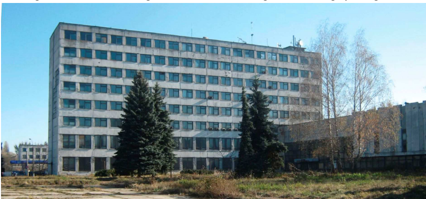
Рис. 3. Хвойні в озелененні адміністративної будівлі ПАТ "Верстатуніверсалмаш"

вих характерна велика кількість хворих та ушкоджених – 2 % від загальної кількості обстежених рослин, що пов'язано із щільним розташуванням їх у групах при створенні композицій, прилеглих до адміністративних корпусів (рис. 3).