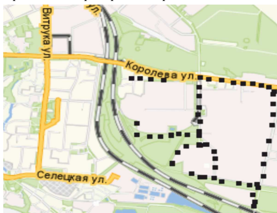
Рис. 1. Схема досліджуваних вулиць промислової зони Житомира

Сучасний Житомир характеризується як місто з високим антропогенним навантаженням, і як наслідок, атмосферне повітря і ґрунти містять важкі метали, залишки від діяльності підприємств та автотранспортних засобів, солі, що спричиняє негативний вплив на деревні рослини. Вуличні насадження обстежували двічі протягом вегетаційного періоду 2014 р. Облік деревних насаджень здійснено безпосередньо на територіях підприємств та на семи вулицях (рис. 1).