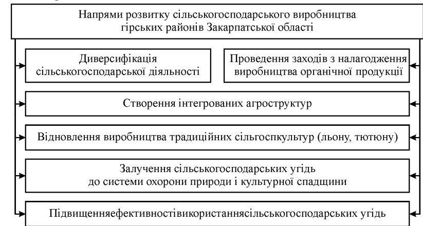
Рис. 1. Пріоритетні напрями розвитку гірського сільського господарства

Перспективи розвитку гірського сільського господарства, на наш погляд, пов'язані з реалізацією низки завдань щодо (рис. 1): підвищення продуктивності та ефективності сільськогосподарського виробництва; налагодження виробництва органічної продукції; диверсифікації сільськогосподарської діяльності; розбудови виробничої і соціальної інфраструктури. Окреслені пріоритети розвитку сільського господарства повинні сприяти формуванню конкурентоспроможних господарств і сталому розвитку галузі. Водночас вони створюють умови для зростання економіки та покращення соціального становища у сільській місцевості, що особливо важливо для гірських територій. Проте варто додати, що гірські райони – це території, які самотужки не здатні вирішити велику кількість соціально-економічних та екологічних проблем і через це потребують постійної державної допомоги.