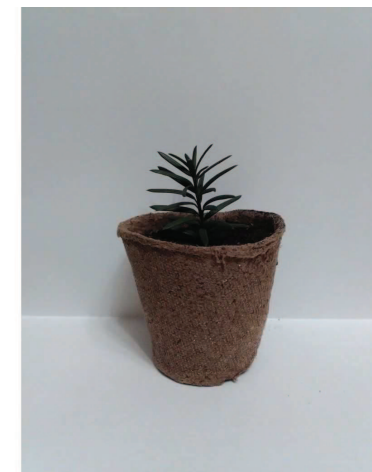
Рис. 4. Адаптований клон тиса ягідного

Після укорінення експлантів проведено їх адаптацію до ґрунтових умов. Для цього отримані клони виймали із пробірок, відмивали стерильною дистильованою водою від залишків живильного середовища та пересаджували у попередньо простерилізований субстрат (суміш дернового ґрунту з піском та торфом (1:1:1) та готові торфотаблетки торгової марки "Jiffy"). Спостереження проводили протягом 35-40 діб. Незалежно від морфологічної відміни досліджуваного виду, отримано в середньому 68 % життєздатних рослин у першому варіанті та 82 % – за використання готових торфотаблеток.