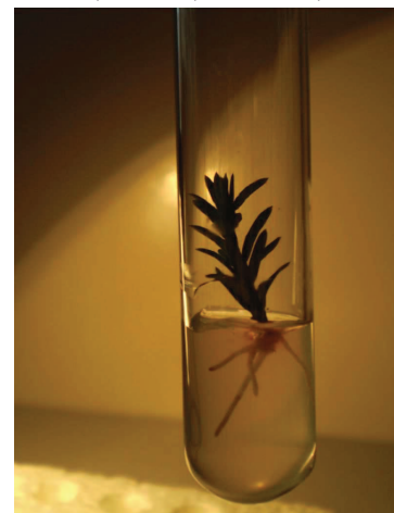
Рис. 3. Укорінений клон тиса ягідного

Отримані дані (див. табл. 3) свідчать, що найкраще коренеутворення характерне для варіанту дослідження № 4 на живильному середовищі 1/2 MS, доповненому 2,4-D (0,2 мг/л) та НОК (0,5 мг/л), де отримали такі результати: типова форма – 76 % укорінених експлантів та в середньому 3,2 корінці на експлант; 'Fastigiata' – 68 % укорінених експлантів та 3,0 корінці; 'Aurea' – 80 % укорінених експлантів та 2,9 корінців. Окрім цього, високі показники укорінення встановлено у варіанті дослідження №1 на живильному середовищі 1/2 LM, модифікованому 2,4-D (0,2 мг/л) та НОК (0,5 мг/л).