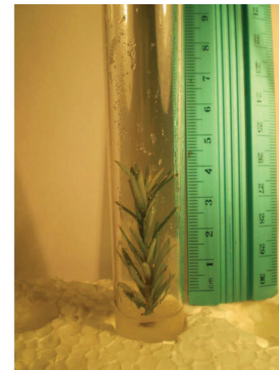
Рис. 2. Ініціація експланта тиса ягідного (45-та доба)

Отримані результати ініціації декоративних форм досліджуваного виду наведено у табл. 1.