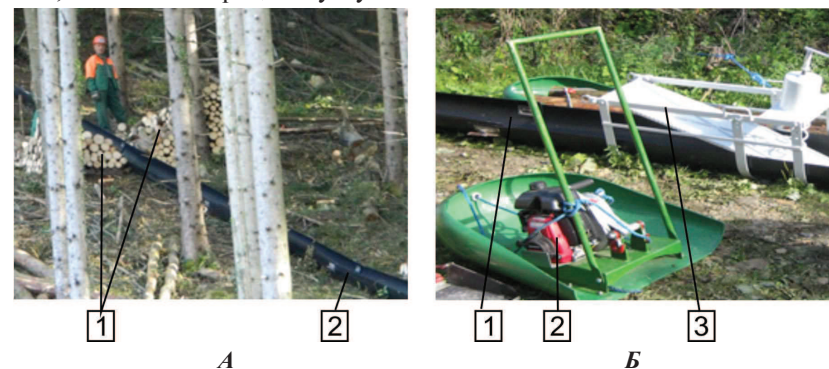
Рис. 2. Пластикові лоткові системи: А) підготовлена до спуску деревини пластикова лоткова система: 1) штабель деревини; 2) змонтований для спуску деревини лоток; Б) елементи пластикової лоткової системи: 1) пластиковий лоток; 2) встановлена на пені мотолебідка; 3) гальмівний пристрій

пластикових лоткових систем є значно меншими порівняно з попередніми способами, а також сам процес спуску є безпечнішим.