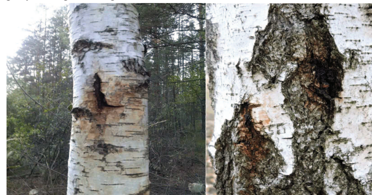
Рис. 5. Характерні симптоми бактеріальної водянки на стовбурі берези повислої: загальний вигляд (зліва), збільшення локальних некрозів на стовбурі з льотними отворами (справа)

Іноді на березі повислій виявляли Inonotus obliquus (трутовик скошений) за базидіомами, який спричиняє білу, корозійну, стовбурну гниль. Важливою діагностичною ознакою In. obliquus є безформенні нарости, т. зв. чага (зазвичай чорного кольору з тріщинуватою поверхнею). Зазвичай непомітний трутовик розміщується під корою відмираючих і відмерлих дерев. Уражена трутовиком деревина спочатку жовтіє, згодом набуває блідо-бурого кольору, в кінцевій стадії стає світлою. Навколо місця гниття утворюється сірувато-коричневе "ядро". На відмерлих стовбурах берези звичні гриби з роду Stereum , які утворюють білу заболоневу гниль. Усі зазначені вище збудники інфекційних хвороб наразі не є першопричиною відмирання берези, чого не можна сказати про судинні хвороби і, передусім, про бактеріози.