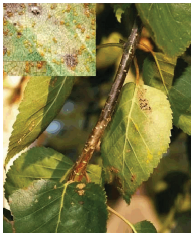
Рис. 2. Уредініопустули M. betulinum з нижнього боку листків берези

Досить чутливими до збудників мікозів є листки берези. Встановлено, що збудником борошнистої роси берези є аскоміцет Phyllactinia suffulta , яка утворює на поверхні листової пластини порошистий, сірувато-білий міцеліальний наліт і призводить до ослаблення, всихання та опадання листків раніше закінчення вегетаційного періоду. Збудник уражує листки на однорічних пагонах. Особливо поширений на сходах сіянців берези та порослі. Проведені дослідження засвідчили, що протягом літа (починаючи з середини) на листових пластинках спостерігалось утворення білого міцелію, а ближче до осені, зазвичай з нижнього боку, утворюються вегетативні плодові тіла – приплюснuto-кулясті клейстотеції (які візуально виглядають як дрібні чорні крапки) з голчастими придатками. Придатки розташовуються екваторіально, вони шилоподібні, з бульбовидно потовщеною основою біля підніжжя плодового тіла. В асках по 2-3 спори. Короткі вирости, т. зв. гаусторії, які утворює міцелій через продихи, проходять у міжклітинні ходи, а надалі в живі клітини [2]. Діаметр клейстотецій – 180-230 мкм, аски – 72-81×29-33 мкм, аскоспори – 34-36×18-20 мкм. Зимуює гриб клейстотеціями на опалому листі. Первинне зараження – аскоспорами.