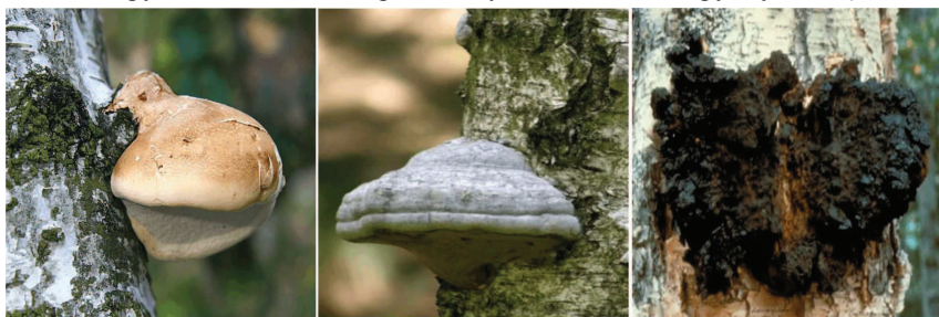
Рис. 4. Базидіоми дереворуйнівних грибів берези повислої: Piptoporus betulinus (зліва), Fomes fomentarius (у центрі), Inonotus obliquus та безплідні нарости – чага (справа)

Серед дереворуйнівних грибів у дослідному регіоні найчастіше трапляється березова губка ( Piptoporus betulinus ), яка інтенсивно уражує дерева берези у т. зв. жердняному віці, спричиняючи стовбурову, ядрово-заболонну, буру, деструктивну, мішану гниль. Вважається, що зараження відбуваються через пошкодження. Разом з тим, встановлено наявність базидіом P. betulinus на зовнішньо непошкоджених стовбурах (рис. 4). Можливо, P. betulinus є складником аутомікобіоти берези (дослідження у цьому напрямку наразі проводимо). Базидіоми березової губки спочатку кулястої форми, з часом вичавлюються з-під кори, забарвлення – від білого до кремово- і темно-сірого, тканина – біла, м'яка. Гіменофор трубчастий, одношаровий; округлі пори в діаметрі до 0,35 мм; безбарвні, циліндричні базидіоспори 5,2×1,36 мкм [4]. Треба зазначити, що на окремих базидіомах P. betulinus відзначено споруючі навесні. Це свідчить про те, що в досліджуваному регіоні вона може мати півторарічну генерацію (після весняної споруючої базидіоми березової губки інтенсивно руйнуються).