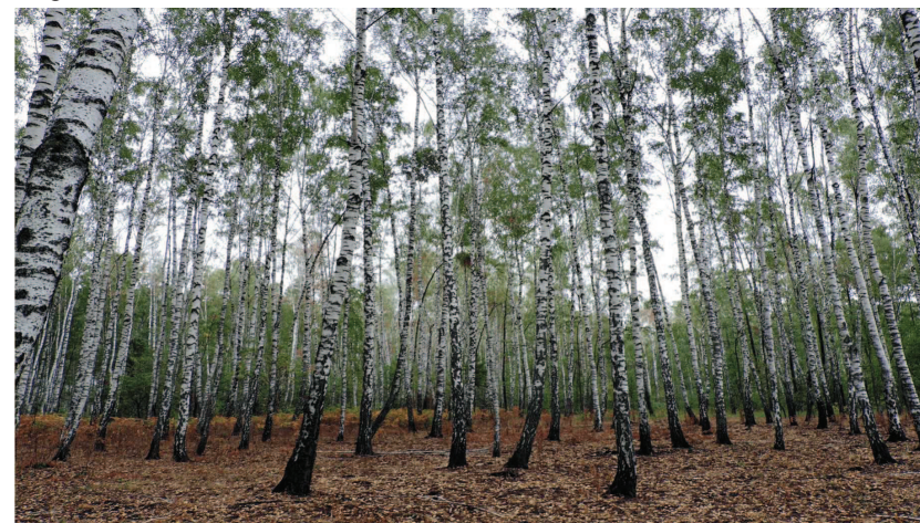
Рис. 1. Дослідне насадження берези повислої (Коростенське лісництво, кв. 27, вид. 17)

Результати дослідження. Насадження за участю берези повислої у Житомирському Поліссі займають площу 110 тис. га або 11,1 % від загальної площі ділянок, вкритих лісовою рослинністю. У цих умовах вона формує як чисті насадження, так і є важливою складовою частиною змішаних сосново-березових і сосново-березово-дубових насаджень (рис. 1). Незважаючи на широку екологічну амплітуду, береза повисла дуже чутлива до різних систематичних і функціональних груп міко-, і мікроорганізмів [1]. Під час проведення лісопатологічних обстежень виявлено широке функціональне і систематичне різноманіття інфекційної патології на вегетативних і генеративних органах цієї цінної деревної рослини. Як показали наші дослідження, наразі на березі повислій трапляються практично всі відомі типи хвороб – від в'янення та плямистостей до некрозів і гнилей.