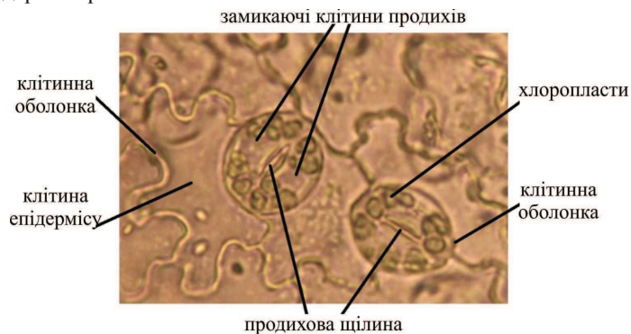
Рис. 1. Продиховий апарат C. kentukea

Найбільшу висоту, діаметр стовбура та річний приріст виявлено у рослин, які росли на відкритому місці за інтенсивності освітлення 67,8 ±1,65 тис. лк. Найменші біометричні параметри зафіксовано на тіньовій ділянці з інтенсивністю освітлення 5,3 ±0,35 тис. лк. На освітленому місці C. kentukea має розлогу напівкулясту, ажурну крону, що розташована на висоті близько 1,5-2,0 м над рівнем ґрунту. В умовах затінення C. kentukea змінює форму крони, вона стає асиметричною, високо піднімається над поверхнею ґрунту, займає прогалини між кронами дерев першої величини.