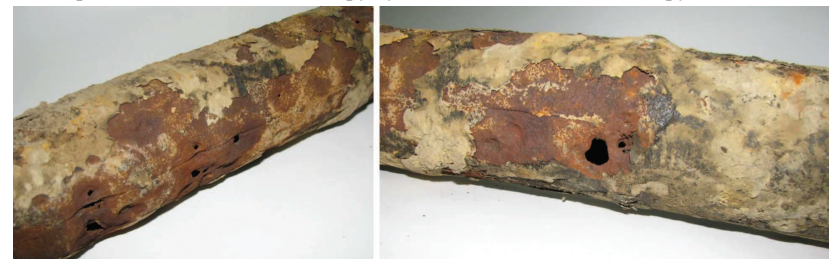
Рис. 1. Фрагменти підземного газопроводу низького тиску (Ø 60 мм) з наявними електрокорозійними дефектами типу "свищ"

Проблема підсилюється ще й тим, що в умовах експлуатації трубопроводів, як правило, піддається одночасному впливу механічних навантажень (деформація), зносу і корозійно-активних середовищ. Така сумісна дія може спричинити пришвидшене корозійно-механічне руйнування трубопроводів, яке значно інтенсифікується під дією полів блукаючих струмів. Під час експлуатації підземних газових мереж низького тиску майже не приділяють уваги боротьбі з електрокорозією під дією змінного струму, вважаючи, що ця проблема торкається лише протяжних магістральних газопроводів за суміжного пролягання з лініями електропередач [1]. Термін "електрокорозія" зазвичай пов'язаний з протіканням постійного струму в підземній металокопструкції.