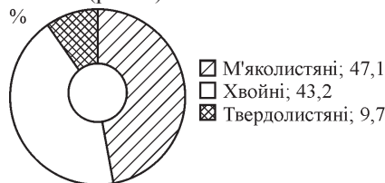
Рис. 1. Фітомаса лісів НПП "Прип'ять-Стохід" у межах груп порід, %

щі насаджень та їх таксаційні характеристики. Матеріали повидільної БД можна використати у різних наукових дослідженнях, зокрема й оцінюванні фітомаси. Станом на 01.01.2013 р., загальний обсяг фітомаси в лісах НПП "Прип'ять-Стохід" становив 1463,64 тис. т. У загальній структурі її обсяги, за групами лісотвірних порід, розподілено так: м'яколистяні – 688,61, хвойні – 632,76 та твердолистяні – 142,26 тис. т (рис. 1).