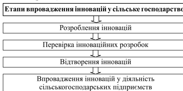
Рис. 2. Основні етапи впровадження інновацій у сільське господарство

Доцільно зазначити, що можливість впровадження інновацій у сільське господарство є вагомим стимулятором зростання національної економіки загалом та засобом вирішення різноманітних соціально-економічних та глобальних викликів у цій сфері. Загалом в економічній практиці, впровадження інновацій у сільське господарство розглядають як процес, який складається із взаємопов'язаних послідовних етапів: розроблення інновацій, їх перевірка, відтворення та впровадження у діяльність (рис. 2).