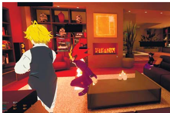
Скрін 3. Аналіз відеоролика з платформи YouTube, як запропонований вибір активності, перша група / Review of a YouTube video as a suggested activity choice, first group

Друга фаза, "Соціальні ролі та відповідальність", передбачала більш структуроване завдання: учасникам було запропоновано спланувати та організувати віртуальну вечірку в межах апартаментів (скрін 4). Вона виявилася особливо інформативною з погляду розподілу соціальних ролей та обов'язків. У всіх групах спостеріга-