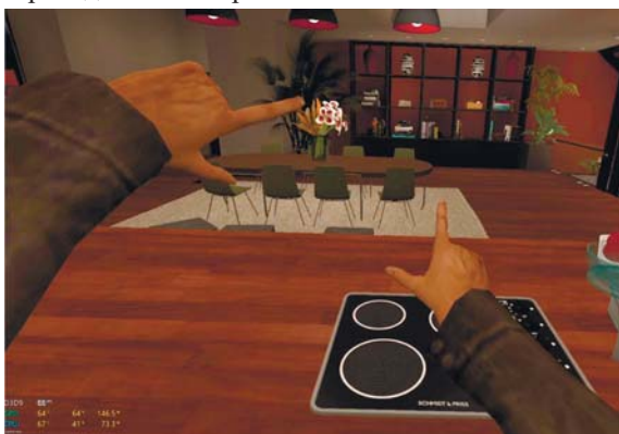
Скрін 1. Віртуальне середовище в рішенні GMod, попередня підготовка до проведення експериментів / Virtual environment in GMod solution, preliminary preparation for experiments

На жаль, GMod не застосовувався у подальших експериментах, застарілий рушій Source та недостатні можливості програмного рішення, на практиці, показали важливість вибору найбільш придатних інструментів для проведення експериментів.