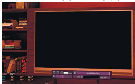
Скрін 2. Вбудований в інтер'єр медіаплеєр, що імітує медіасистему у віртуальному середовищі / Media player integrated in the interior that simulates a media system in the virtual environment

У першій фазі, названій "Дослідження та взаємодія", учасникам було надано повну свободу дій для ознайомлення з віртуальним простором та встановлення контакту один з одним. Спостерігач фіксував, як добровольці досліджували різні зони апартаментів, які теми для розмов вони обирали, і як формувалися перші соціальні зв'язки між ними. Цікаво відзначити, що в чотирьох з п'яти груп уже впродовж перших 15 хвилин почали виділятися неформальні лідери, які пропонували ідеї для спільних активностей, наприклад, перегляд відеороликів на вбудованому в інтер'єр медіа-плеєрі (скрін 2, 3).