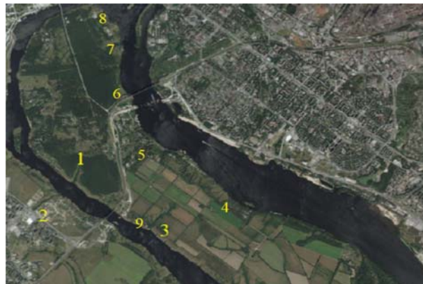
Рис. 1. Схема розташування балок, в яких здійснювали дослідження / The layout of the ravines in which the research was carried out: 1 – Генералка / Generalka; 2 – Хортицька / Khortytska; 3 – Широка / Shyroka; 4 – Велика Башмачка / Velyka Bashmachka; 5 – Ганнівка / Hannivka; 6 – Ушви́ва / Ushvyva; 7 – Велика Молодня́га / Velyka Molodniaha; 8 – Сову́тина / Sovutyna; 9 – санаторій-профілакторій ПАТ "Запорізький завод феросплавів" (ЗЗФ) / sanatorium-prophylactorium of Zaporizhzhia Ferroalloys Plant PJSC

де: A – кількість видів на першій ділянці; B – кількість видів на другій ділянці; C – кількість загальних видів [14].