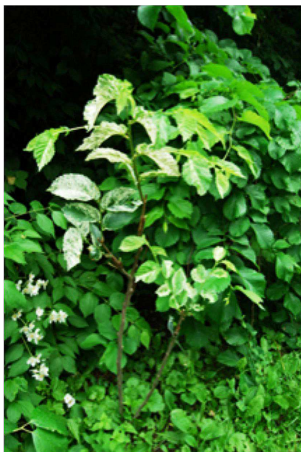
Рис. 2. Щеплення способом копулювання "модифікований (СВФ) поліпшений вприклад" декоративної форми U. g. 'Albo-variegata'

Аналізуючи дані табл. 1 та 2, встановлено, що для усіх досліджених декоративних форм можна використовувати в ролі підщепи як U. glabra , так і U. laevis . За використання плакучої форми U. g. 'Pendula' у вигляді солітера в різних ландшафтних композиціях, для щеплення потрібно використовувати рівні штамби самосіви U. glabra і U. laevis різних висот.