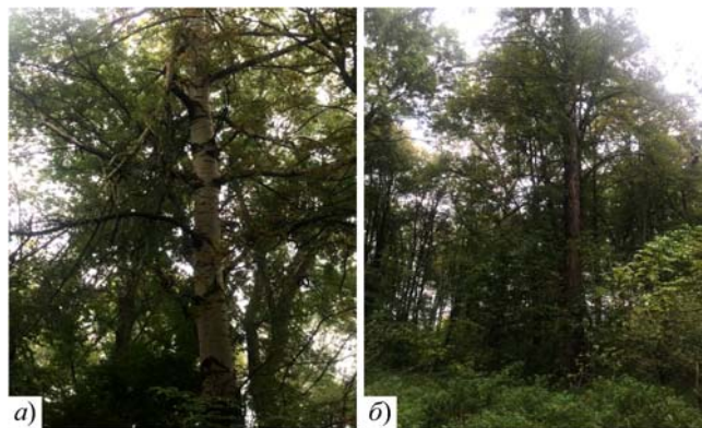
Рис. 8. Вікова Populus × canescens (Ait) Smith (a) та вікова Larix decidua у парковому фітоценозі (б)

Під час обстежень виявлено поодинокі вікові дерева. Це названі вище екзоти ( Juglans nigra та J. mandshurica , Phellodendron amurense ) із обхватом стовбура від 0.6 м; Acer sacharinum та A. negundo – із обхватом стовбура 0.9-1.4 м. Аборигенними віковими особинами є Populus nigra L., P. ×canescens та P. alba L. – обхват 1.2-1.4 м; Picea abies (L.) Karst.) та Larix decidua Mill. (рис. 8), обхват яких перевищує 0.7 м.