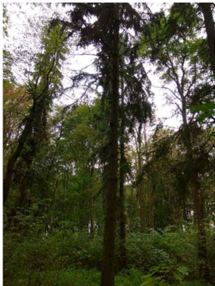
Рис. 5. Збережені вікові групи Picea abies (L.) Н. Karst.

просторів. Напіввідкриті простори спостерігаються вздовж русла річки Веретено та алеї, що простягається вздовж північної межі парку. Відбулася повна трансформація галявин. Спостерігається зміна видових точок на окремих ділянках. Потрібне впорядкування дорожньо-стежкової мережі, структури візуальних зв'язків та композиційних акцентів із деревних рослин та малих архітектурних форм.