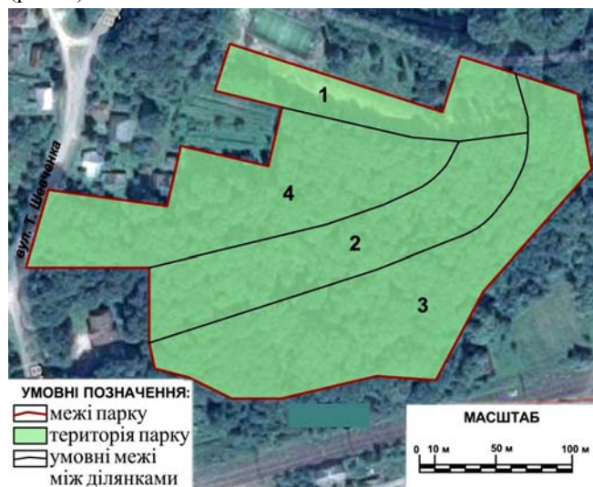
Рис. 2. Карта-схема "Дублянського парку" з умовним поділом території на ділянки

Для проведення досліджень, територію об'єкта загальною площею 4,9 га, умовно поділено на 4 ділянки (рис. 2).