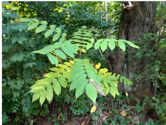
Рис. 7. Поновлення Juglans mandshurica

У складі паркового фітоценозу смт Дубляни є інтродуковані види, а саме: Juglans nigra та J. mandshurica , Phellodendron amurense , Acer sacharinum та A. negundo . За таких умов зростання для цих видів характерна досить висока стійкість. Деякі з них дають природне поновлення (рис. 7).