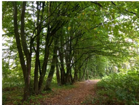
Рис. 3. Збережений грабовий боскет як елемент давнього регулярного закладення (фото Петришин Г. П., 2019)

Ділянка 2. Розташована вздовж головної алеї в середині парку. Межа цієї ділянки проходить по віковому грабовому боскеті (рис. 3) та зруйнованій липовій алеї (рис. 4,а). Окремими особинами вздовж алеї є солітери інтродукованих видів: Juglans nigra L. та J. mandshurica , Phellodendron amurense Rupr, Acer saccharinum L. та A. negundo L. У глибині ділянки поширені мікрогрупування: дуб звичайний+клен-явір+береза повисла; липа дрібнолиста+клен гостролистий; ялина європейська+береза повисла+липа дрібнолиста+черешня. У підрослі переважає самосів Acer platanoides L. та A. pseudoplatanus .