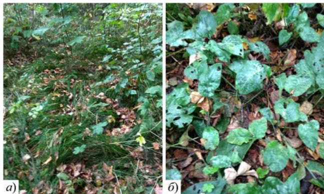
Рис. 9. Carex brizoides (а) та Pulmonaria obscura у піднаметовому трав'яному вкритті (б)

У складі трав'яних рослин здебільшого переважають лісові види. Це пов'язано із тим, що це рослинне угруповання як штучне, не забезпечувалося регулярним доглядом. Найвища частота трапляння та проєктивного вкриття від 70 до 90 % спостерігається у Carex brizoides L., Stellaria holostea L., Aegopodium podagraria L., Pulmonaria obscura Dumort., Galeobdolon luteum Huds. – типових індикаторів природних дубових і букових лісів. Їх ценопопуляції виступають фоном трав'яного вкриття, поширюючись великими плямами (рис. 9).