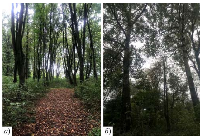
Рис. 4. Залишки липової алеї (а) та мікрогрупування за участі Populus x canescens (б)

Ділянка 3. Розташована у перезволоженому гіротопі вздовж річки Веретено. Переважають мікрогрупування: тополя сірюча+вільха чорна+тополя біла+верба ламка (рис. 4,б). На більш підвищених ділянках поширені мікрогрупування: береза повисла+в'яз голий+клен гостролистий.