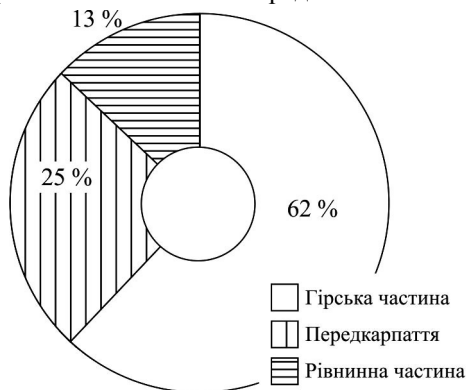
Рис. 1. Фізико-географічне районування заповідних об'єктів Івано-Франківщини

місцевого значення є регіональні ландшафтні парки "Дністерський", уздовж Дністра, на території Тлумачького і Городенківського районів, і "Полянський" – на території Болехівської міської ради.