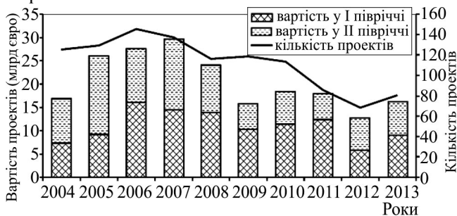
Рис. 3. Динаміка розвитку ДПП в Європі

Динаміку розвитку ДПП в Європі, за даними Європейського центру з дослідження публічно-приватного партнерства (ЕРЕС) (Market Update, 2019), зображено на рис. 3.