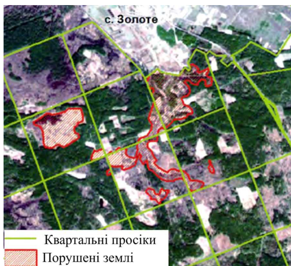
Рис. 3. Порушені землі, виявлені під час аналізу знімків Sentinel-2 (Yanchuk, Prokopchuk & Trokhymets, 2017)

Зеленим кольором позначено ділянки з більшим вмістом води у ґрунті, червоним – сухіші ділянки. За-