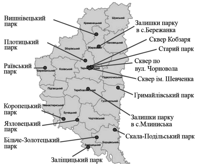
Рис. 1. Схема розміщення парків-пам'яток садово-паркового мистецтва на території Тернопільської області

Результати дослідження. У 1991 р. Тернопільську обл. поділено на 17 адміністративних районів. Дослідні об'єкти розташовані у 10 районах області (11 об'єктів) та у межах території Тернополя – 4 об'єкти (рис. 1).