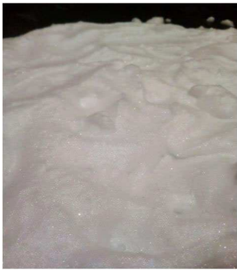
Рис. 1. Загальний вигляд компресійної піни, діаметр бульбашок від 0,08 до 0,2 мм

ньої та низької кратності піноутворювачів загального призначення знаходиться у межах від 2 до 5 мм. Використовуючи спеціальні ПУ, можливо отримувати таку піну з розмірами бульбашок від 1,8 до 2,5 мм. Щодо однорідності бульбашок – інформація не надається. Згідно з інформацією в іноземних джерелах, орієнтовний розмір бульбашок КП повинен бути не більше ніж 0,6–0,8 мм. Автори (Doga, 2012) стверджують, що "піна хорошої якості є однорідна, складається з дуже маленьких бульбашок, які, наприклад, мають середній еквівалентний діаметр в інтервалі від 0,5 до 1 мм". У попередніх дослідженнях (Nikulin, Kodrik & Titenko, 2018) отримана нами КП складалася з бульбашок діаметром від 0,08 до 0,2 мм, (рис. 1), що значно менше від зазначених вище і що повинно позитивно впливати на характеристики якості піни, наприклад на її стійкість. Стійкість такої компресійної піни повинна зростати під час зменшення діаметра бульбашки.