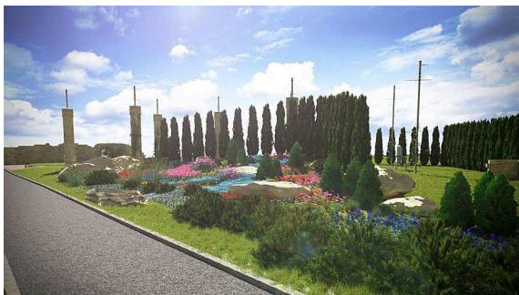
Рис. 5. Кам'янисто-квіткова композиція

bifolia ), гвоздика-трав'янка (лат. Dianthus deltoides ), горлянка повзуча (лат. Ajuga reptans ) (Bobyleva, 2010). Прекрасним доповненням дизайну античного саду стануть камені різного розміру: від величезних валунів до невеликих каменів. Такі злаки, як костриця валісска (лат. Festuca valesiaca ) і міскантус китайський (лат. Miscanthus sinensis 'Zebrinus' ), надаватимуть композиції природності (рис. 5).