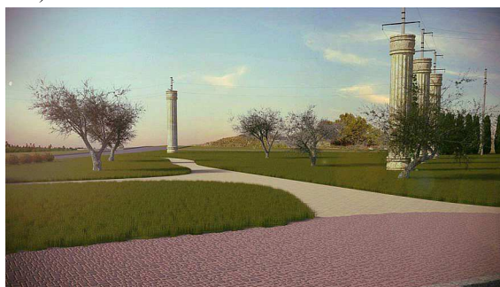
Рис. 4. Стовпи електромереж, стилізовані під давньогрецькі колони

Фоном квітника буде декоративна стіна, увита виноградом Віча. Далі по східній експозиції ділянки вздовж дороги за декоративною стіною заплановано розташувати майданчик, що має нагадувати частину агори і бути викладеним зі стилізованої бруківки. У північно-західному напрямку від нього спроектовано "зарослу" доріжку з дрібного щебеню, що пройде крізь рядове насадження маслинки вузьколистої (лат. Elaeagnus angustifolia ), що додасть ще більше "грецького" колориту. Розташовані в центрі ділянки стовпи ЛЕП, за проектом, мають бути стилізовані під стародавні колони і повиті виноградом Віча (лат. Parthenocissus Veitchii ) (рис. 4).