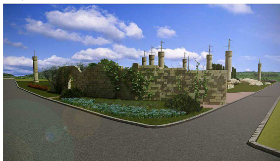
Рис. 3. Квітник на розі біля в'їзду

проліскою дволистою (лат. Scilla bifolia ) та нарцисом вузьколистим (лат. Narcissus poeticus ). Квітник має оточити ялівець лускатий (лат. Juniperus squamata 'Blue Carpet') і костриця валісска (лат. Festuca valesiaca ) (рис. 3).