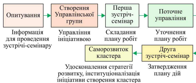
Рис. 2. Етапи створення локального рекреаційно-туристичного кластера в Кейлічі (Volkov, 2016)

На локальному рівні, де найвідчутніші соціально-економічні наслідки розвитку рекреаційно-туристичної сфери, ініціативи створення туристичних кластерів особливо важливі. Так, одна з найсильніших спільнот розвинулася в районі Кейліча (Khayelitsha), розташованого недалеко від Кейптауна. Цей район було вибрано як полігон для створення одного з чотирьох локальних РТК. Нерозвинена туристична сфера, конкуренція з боку інших туристичних районів країни, складна криміногенна ситуація – стартові умови для формування РТК в Кейлічі. Ініціювали його створення туристична адміністрація Капської провінції, яка на початок надала фінансову підтримку, і муніципалітет Тайге (Tyger). Робота відбувалася у кілька етапів (рис. 2). Одним із перших кроків було навчання в Кейлічі Управлінської групи з представників різних зацікавлених організацій. Під час проведених нею семінарів, консультацій, робочих зустрічей з широким колом учасників, починаючи з місцевих жителів і працівників туристичної індустрії до політичних діячів і міністра туризму ПАР, було вироблено план дій за трьома стратегічними напрямками – підготовка кадрів, маркетинг і забезпечення безпеки. Активну роль на цьому етапі взяли на себе члени міжнародного консорціуму ТСС, які надавали консалтингові послуги. Зазначимо, що ініціатива створення кластера походила знизу, всі зацікавлені сторони спільними зусиллями на місці виробляли стратегію розвитку за підтримки процесу прийняття рішень згори.