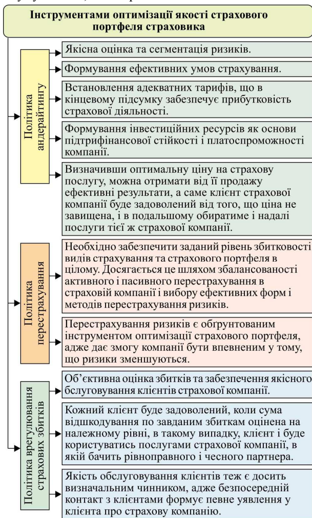
Рис. 2. Інструменти оптимізації страхового портфеля страхових компаній в сучасних умовах

вимоги до перестраховиків, 16 % – нерухоме майно, 4 % – акції дочірньої компанії. Перевищення чистих активів над величиною статутного капіталу становить 335453,4 тис. грн. Станом на 31.12.2017 р. фактичний запас платоспроможності становить 616416,6 тис. грн, що перевищує нормативний запас платоспроможності на суму 452053,6 тис. грн.