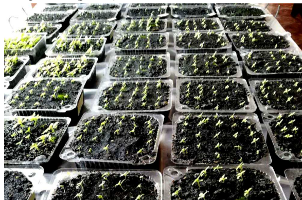
Рис. 2. Результати пророщування насіння павловнії повстистої

Облік пророслого насіння виконували на 14-й день спостережень (рис. 2).