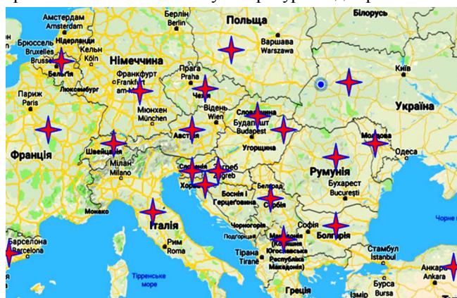
Рис. 1. Поширення плантацій представників роду Paulownia у країнах Європи: ★ – країни з наявними промисловими та (або) дослідними плантаціями видів чи гібридів роду Paulownia .

Вступ. Плантаційне вирощування павловнії повстистої та її гібридів здійснюють впродовж останніх 40 років як у країнах Південно-Східної Азії (на батьківщині породи), так і в інших країнах Азії, Європи (рис. 1), Північної та Південної Америки і Австралії (Hakan & Kol, 2010; Hugo et al., 2013; Icka, Damo & Icka, 2016; Woods, 2008; Zhu et al., 1986). Карту поширення плантацій представників роду Paulownia у країнах Європи зроблено на основі аналізу літературних джерел.