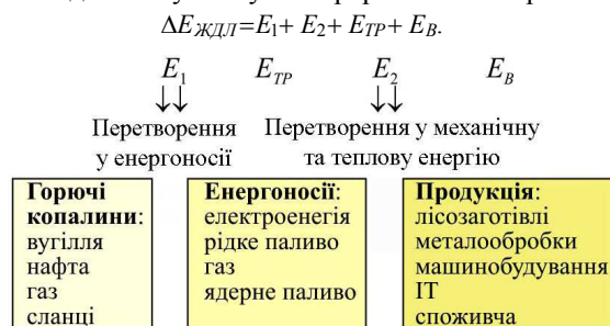
Рис. 3. Схема формування енергетичних втрат під час перетворення горючих копалин у додаткову продукцію: E_1 – енергетичні втрати під час перетворення горючих копалин у енергоносії; E_{ТР} – енергетичні втрати, зумовлені необхідністю транспортування енергоносіїв до місця їх споживання; E_2 – енергетичні втрати під час вироблення механічної енергії із енергоносіїв – для технологічних потреб; E_B – теплові втрати у виробничих процесах перероблення сировини у продукцію.

Надлишкова енергія життєдіяльності людини формується у таких технологічних процесах: видобування горючих копалин, вироблення та транспортування енергоносіїв до місця їх споживання, теплові втрати під час перетворення енергоносіїв у механічну енергію та під час технологічних процесів виготовлення додаткової продукції (рис. 3). Додаткова енергія життєдіяльності людини є сумою усіх перерахованих втрат: