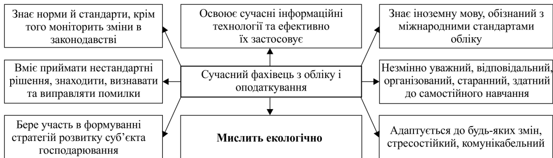
Рис. 1. Напрями використання засвоєних знань, умінь та навичок у професійній діяльності фахівця для вирішення теоретичних і практичних завдань

Сьогодні незаперечним є стрімкий процес щодо змін не тільки в економіці, але й в середовищі, невіддільному від неї: суспільстві, довкіллі та інформаційній сфері. Традиційний підхід до функціонування бізнес-середовища, що втілюється у максимізації прибутку від діяльності суб'єктів господарювання, ґрунтується на залученні усіх ресурсів, у т.ч. вилученні природних ресурсів, часто неконтрольованому. Лінійне мислення, що втілює наведене вище, однозначно, потребує змін крізь призму всебічного розуміння, навчання та впровадження у практичну сферу принципів сталого розвитку (рис. 2).