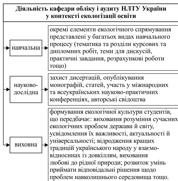
Рис. 4. Діяльність кафедри обліку і аудиту НЛТУ України у контексті екологізації освіти

шляхи формування інтелектуального розвитку студентів на засадах професійності та усвідомленості їхньої майбутньої діяльності.