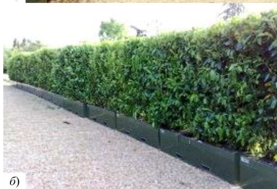
Рис. 1. Мобільні живоплоти

Мобільними живоплотами вважаємо різноманітні насадження кущових, деревних, витких рослин, що висаджують у прямокутні горшки, з подальшим форму-