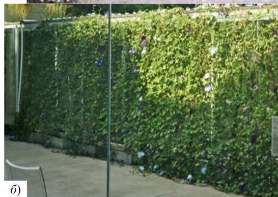
Рис. 4. Каркасні мобільні живопліти

Окрім багатьох переваг мобільних живоплотів перед звичайними, в них є і недоліки – висока ціна, потреба у постійному догляді, швидка втрата вологи, внаслідок підвищеної температури ґрунту у горшках. Частину з цих проблем вдається подолати завдяки новітнім розробкам, наприклад автономному поливу, а також застосуванню гідрогелю.