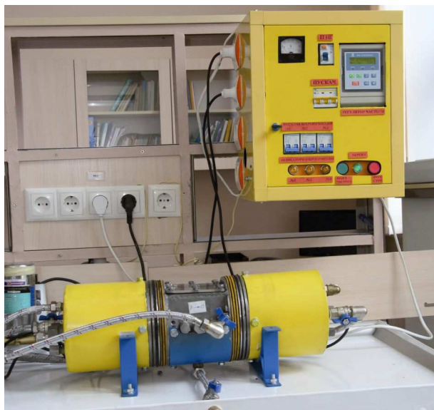
Рис. 1. Світліна низькочастотного електромагнітного кавітатора резонансного типу для кавітаційного оброблення води для поливу та зрошування сільськогосподарських культур (із частково знятими захисними елементами кожуха)

Для високопродуктивної кавітаційного оброблення води для різноманітних господарських потреб, зокрема і для поливу та зрошування сільськогосподарських культур, автори створили низькочастотний резонансний віброкавітатор, світліну якого зображено на рис. 1. Істотною перевагою цього кавітатора є те, що він забезпечує якісну кавітаційне оброблення рідин під тиском до 2,0 \text{ кг/см}^2 , внаслідок чого істотно (до 1,5\text{--}2,0 \text{ м}^3/\text{год} ) зростає його продуктивність і декілька паралельно з'єднаних кавітаторів спроможні забезпечити оброблення таких значних обсягів води, які достатні для поливів та зрошування рослин навіть на великих площах.