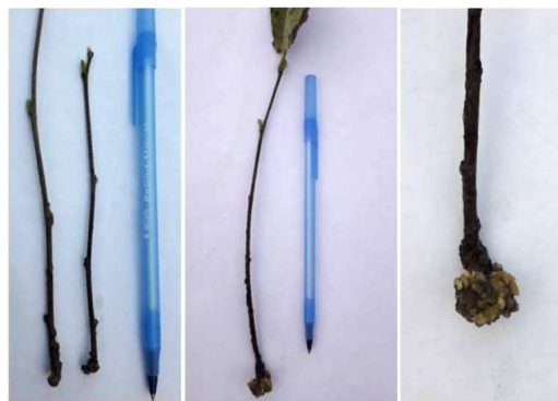
Рис. 2. Особливості формування калюсу у живців фундука внаслідок формування 1–2 бруньок (а), а також збереженості листка та формування бруньок (б, в) в умовах теплиці ДП "Гайсинське ЛГ", 2017

Сорти, які характеризувалися загибеллю усіх живців "Превосходний-2", "Серебристий" та "Лозівський булавовидний", не були представлені в усіх варіантах. Тому було розраховано середні значення без урахування цих сортів. За розрахунковими даними, найефективнішим виявилось попереднє замочування у воді та використання препарату "Grandis". Наявність збереженого листа та розвинених бруньок сприяли росту калюсу (рис. 2).