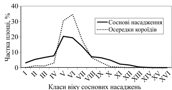
Рис. 2. Розподіл площі всіх соснових насаджень і осередків короїдів за класами віку (ДП "Володимирецьке ЛГ")

У віковій структурі соснових насаджень ДП "Воло-димирецьке ЛГ" яскраво виділяється період V-VIII кла-сів віку, на який припадає 62,0 % площі всіх соснових насаджень і 90,9 % площі осередків короїдів (рис. 2).