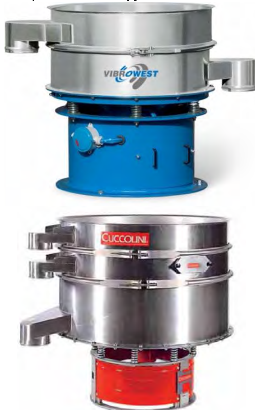
Рис. 1. Вібросепаратори італійських фірм VIBROWEST та CUCCOLINI

ратора. Проведені дослідження описують тільки загальну поведінку шару матеріалу у віброуючому контейнері та потребують детальнішого розгляду та вдосконалення. Тому важливою задачею є продовжити попередні дослідження та побудувати математичну модель визначення амплітуди та частоти сипкого матеріалу залежно від його фізико-механічних характеристик, швидкості руху вздовж сита, що в подальшому дасть змогу оптимізувати ефективність сепарування.