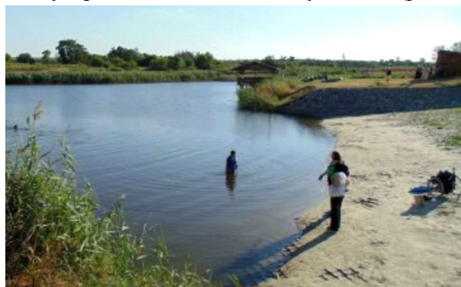
Рис. 3. Сучасний стан об'єкту

Тваринний світ характерний для степової зони – гризуни, птахи: зозуля сіра, ворони, галка, коноплянка, зяблик, сорокопуд, дрізд, сорока, соловей, сова, синиця, славка, ластівка, грак, шпак, крижні, чирки, сірі куріпки, перепели та ін. Осимі та вирійні птахи: дрохва, кроншнеп, вальдшнеп і бекас. Амфібії: ропуха звичайна, жаба ставкова. Плазуни: ящірки, вужі, степові полози, степова гадюка (отруйна). У водоймах риби: лящ, короп, чехоня, судак, бички. Немає будинків і споруд, благоустрою та підземних комунікацій (рис. 3).