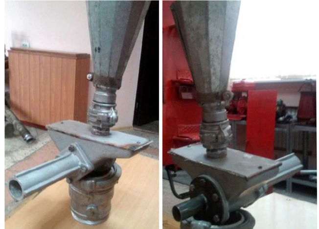
Рис. 2. Дослідно-експериментальний зразок ЕАПП

Унаслідок теоретичного опрацювання тактико-технічних вимог і конструкції ЕАПП створено дослідно-експериментальний зразок ЕАПП (рис. 2).