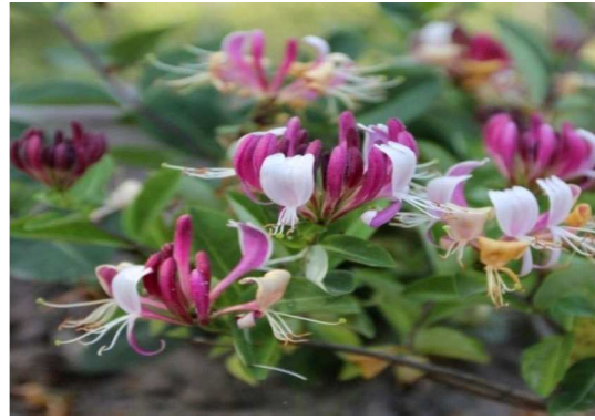
Рис. 2. Цвітіння жимолості каприфоль в умовах біостаніонару ВНАУ

Першою зі стану спокою виходить жимолость каприфоль, пізніше – жимолость звичайна. У жимолості каприфоль терміни завершення вегетації майже збігаються із термінами місцевих порід, або дещо виходять за межі вегетаційного періоду, внаслідок чого в деякі зими кінці їх однорічних пагонів пошкоджувались. Незважаючи на це, рослини цвіли і плодоносили. Середня тривалість вегетації досліджуваних видів становить близько 227 днів (рис. 2).