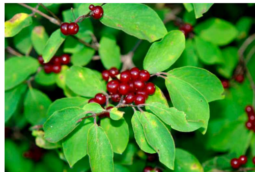
Рис. 3. Плодоношення жимолості звичайної (біостаніонар ВНАУ)