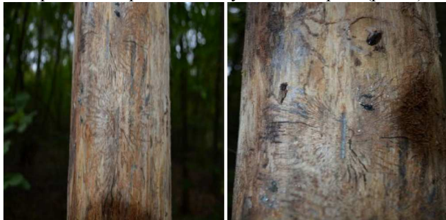
Рис. 2. Ходи заболонників на модельних деревах

Для виявлення видового складу та перспектив розмноження стовбурових шкідників на типових пробних площах проаналізовано модельні дерева, для аналізу використали вітровальні та сухостійні дерева (рис. 2).