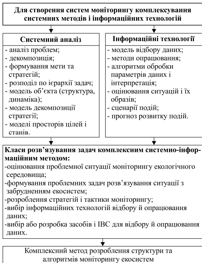
Рис. 1. Методи створення інтегрованих моделей екологічних систем

Такі моделі створюють на підставі теорії великих систем, теорії моделювання, системного аналізу та інформаційних технологій для оброблення та інтерпретації даних і результатів модельного експерименту як у цифровій, так і в аналоговій формах (рис. 1).