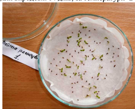
Рис. 2. Пророщення насіння вейгели рясноцвітої ( Weigela floribunda (Sied. et Zucc.) C. Koch)

папері, за температури +20-22°C, підтримуючи постійну вологість. Дослідження проводили в чотириразові повторюваності, по 100 шт. насінин у кожному варіанті (спостереження проводили щоденно). Стратифікацію проводили впродовж 14 днів, за температури -2 °С.