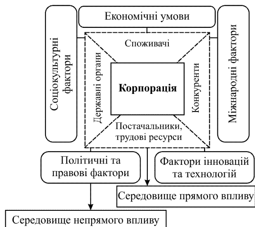
Рис. 3. Фактори зовнішнього впливу на корпорації (розробив автор із використанням джерела [3])

Для досягнення основної мети компанії – отримання прибутку – необхідно враховувати чинники як зовнішньої, так і внутрішнього середовища. Внутрішнє середовище корпорації – це організаційна побудова і внутрішні ситуаційні фактори. Внутрішні елементи системи корпоративного управління залежать насамперед від наявності ефективних норм і процедур взаємовідносин власників і їх впливу на менеджмент підприємства. До них належать: власники, менеджмент, працівники. Усі ці суб'єкти мають складну систему інтересів і її узгодження є основним завданням оптимізації корпоративного управління.