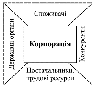
Рис. 2. Зовнішні фактори прямого впливу на корпорації (авторська розробка)