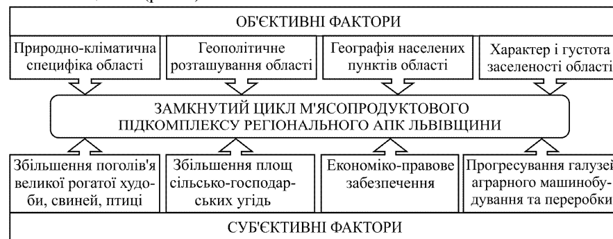
Рис. 2. Перспективи розвитку замкненого циклу м'ясопродуктового підкомплексу регіонального АПК Львівщини

Економічна природа заходів державного регулювання м'ясопродуктового підкомплексу регіонального АПК, предметною галуззю яких є виробничо-господарська діяльність великих агровиробників, пов'язана здебільшого із підтримкою прогресивних організаційно-економічних технологій. Обґрунтувати це можна тим, що на відміну від сільських домогосподарств стимулювання конкретних суб'єктів АПК є недоцільним, оскільки може спричинити монополізацію галузевого ринку та порушення умов добросовісної конкуренції [4]. Тому кращим варіантом розвитку масштабного м'ясопродуктового виробництва є економічне заохочення господарюючих одиниць до впровадження сучасних методик і механізмів аграрно-промислового виробництва, наприклад організації замкнених циклів (рис. 2).